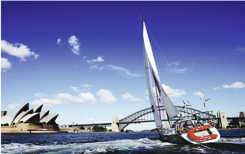
Die Pachamama der Schwörers erreicht den Hafen von Sydney.